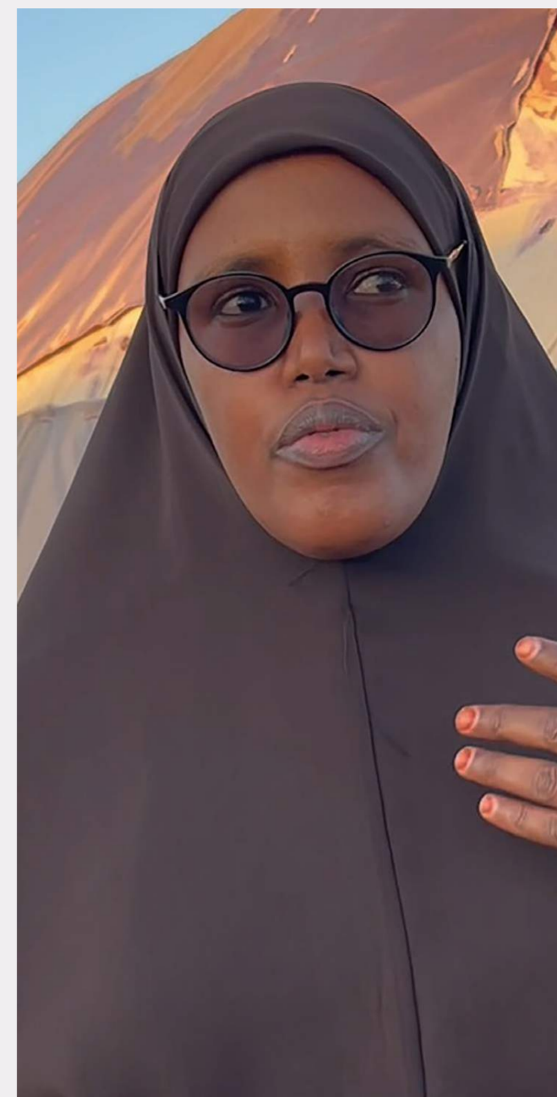
Anfa , asyentka ds. wodno-sanitarnych w Somalii