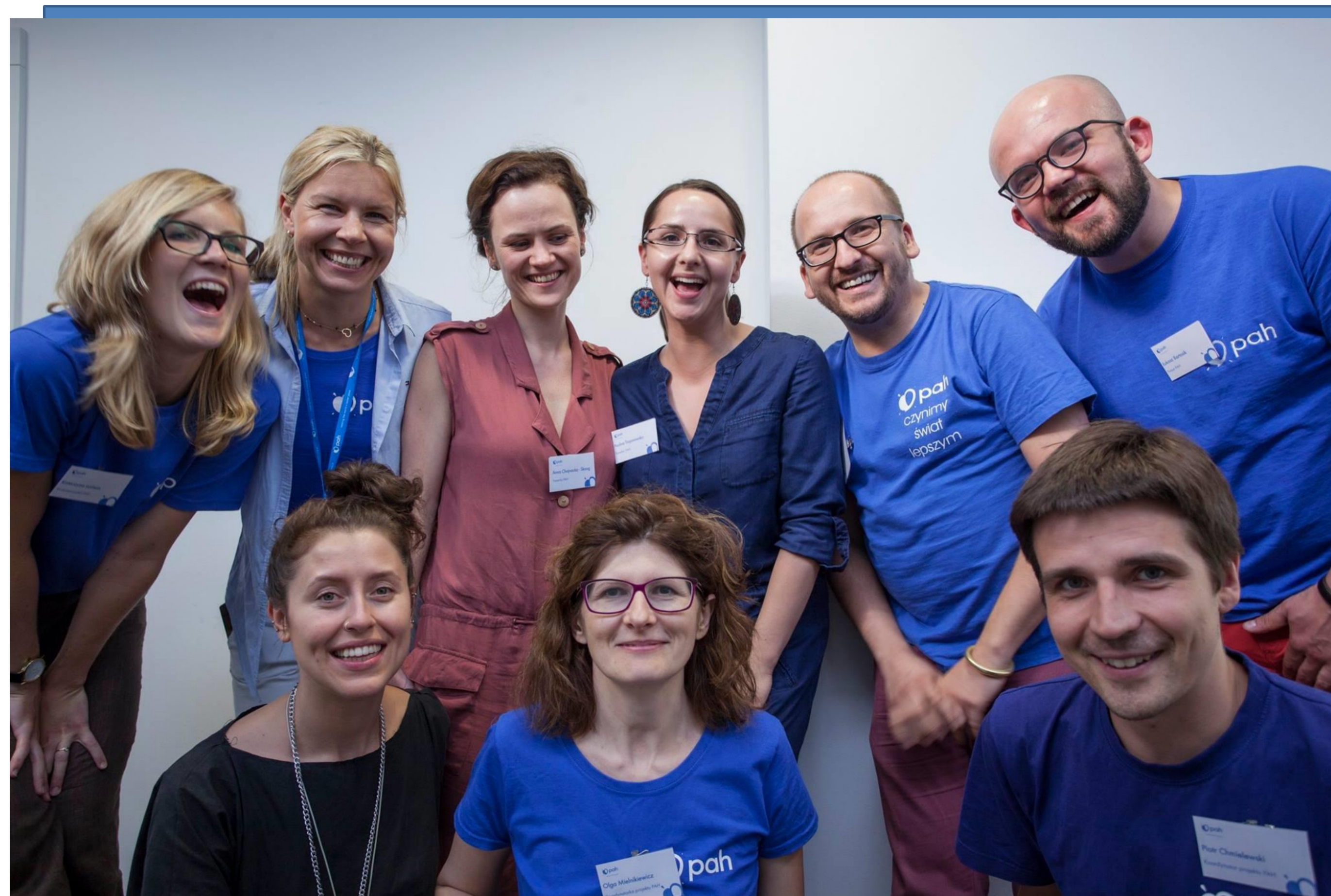
Część zespołu trenerskiego PAH podczas konferencji programu Szkoła Humanitarna

PAH realizuje nie tylko działania pomocowe w Polsce - Program Pajacyk i poza granicami naszego kraju - pomoc humanitarna , ale także projekty i programy edukacyjne w obszarze edukacji globalnej . Wierzymy, że wiedza to jedna z najskuteczniejszych form zmieniania świata.