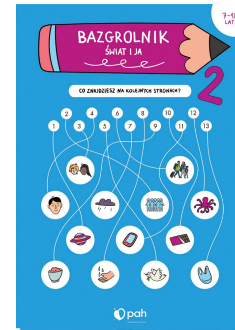
BAZGROLNIK. ŚWIAT I JA (7-10 lat)