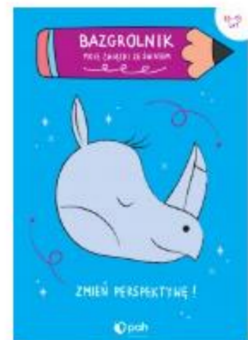
BAZGROLNIK. MOJE ZWIĄZKI ZE ŚWIATEM (10-13 lat)

Dochód ze sprzedaży jest przeznaczony na działania pomocowe PAH!