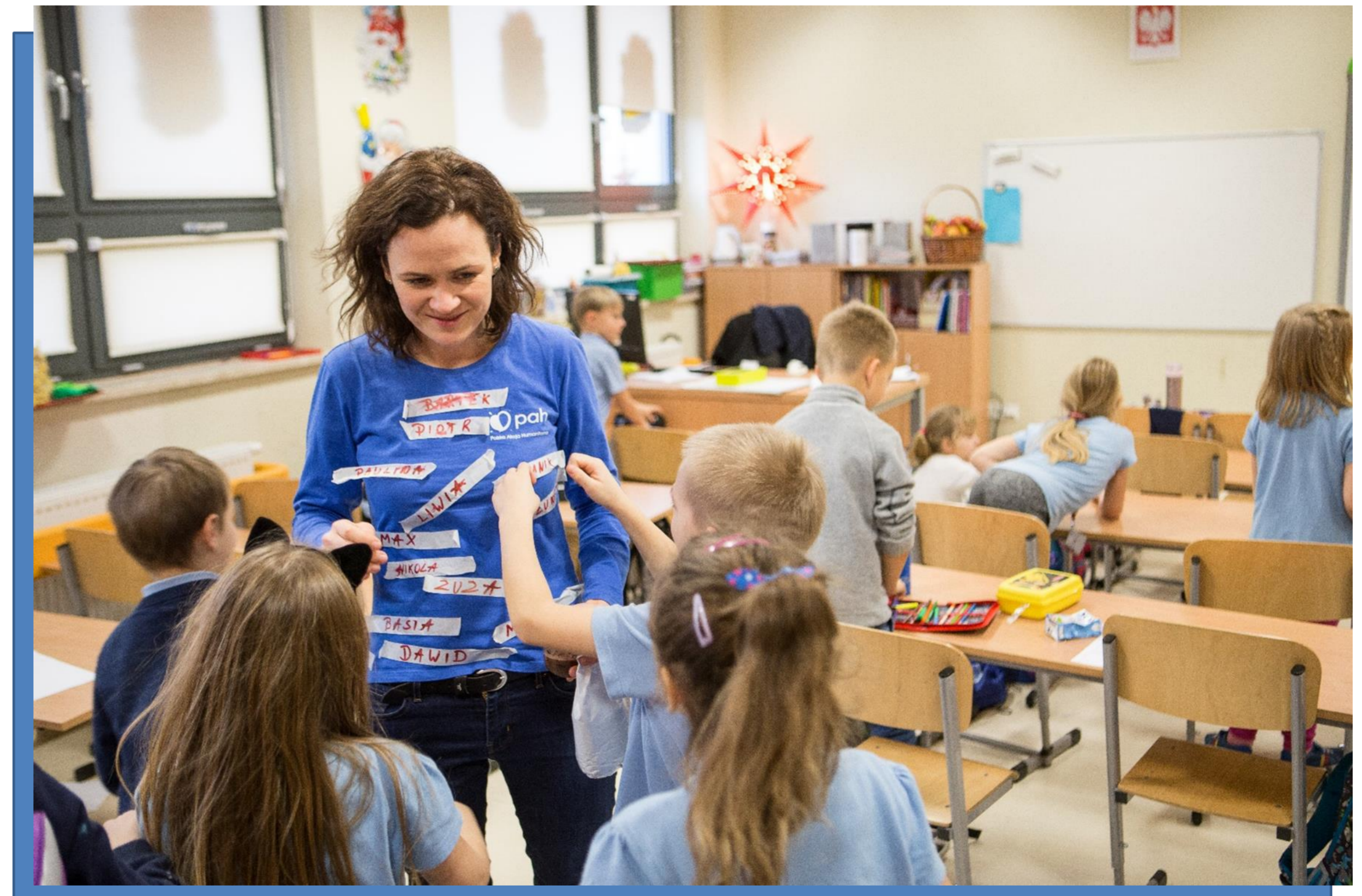
Warsztaty trenerskich w Pozytywnej Szkole Podstawowej w Gdańsku