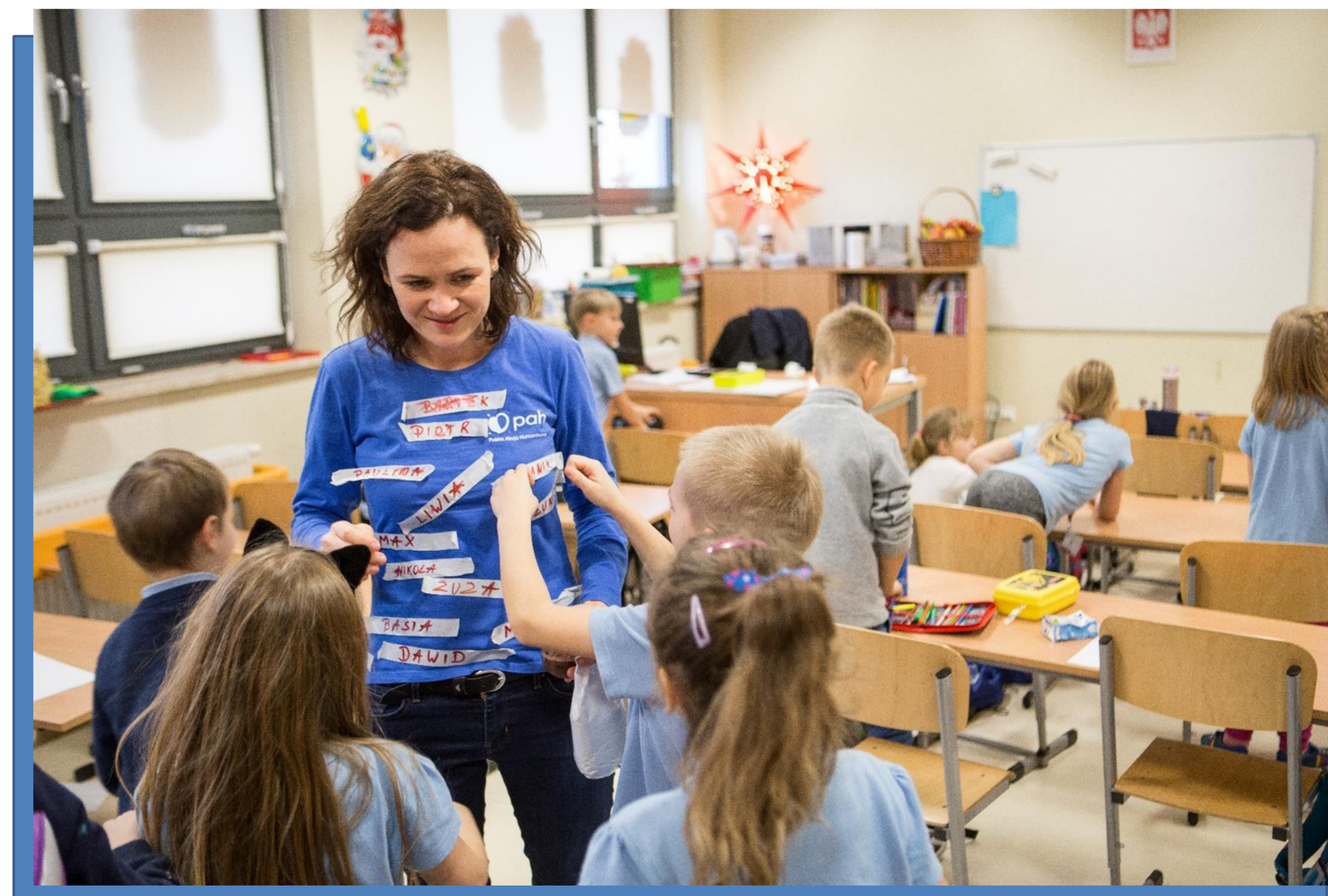
Warsztaty trenerskich w Pozytywnej Szkole Podstawowej w Gdańsku